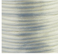
Avorio - 02