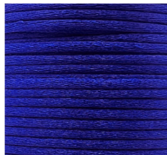
Bluette - 18