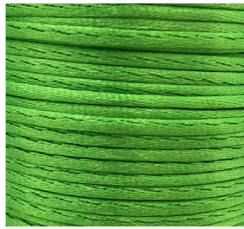
Verde Chiaro - 07