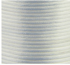
Bianco - 01