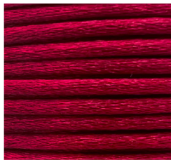
Bordeaux - 28