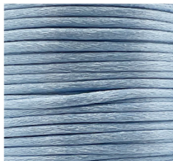
Azzurro - 17