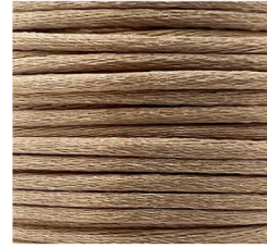
Beige - 24