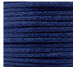
Blu - 27