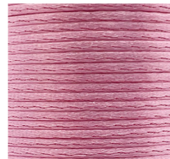
Rosa - 21