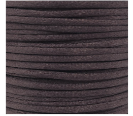
Marrone - 23