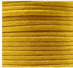
Giallo - 22