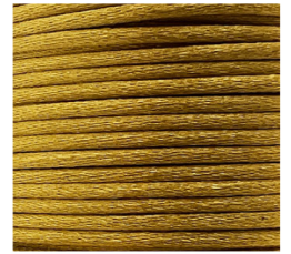
Oro - 34