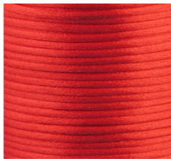
Rosso - 03