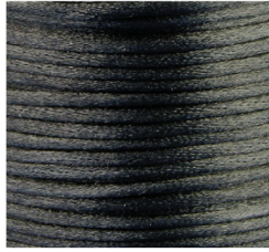
Nero - 04