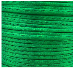
Verde - 09