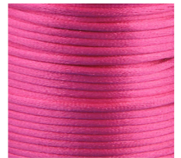
Ciclamino - 16