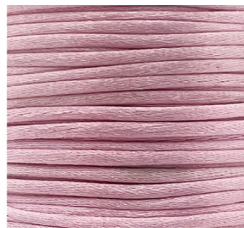
Rosa Confetto - 15