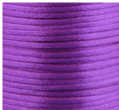
Lilla Scuro - 10