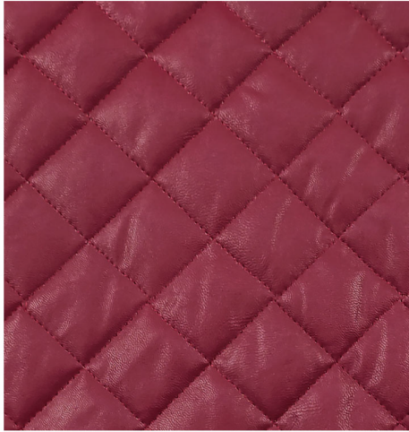
BORDEAUX - 28