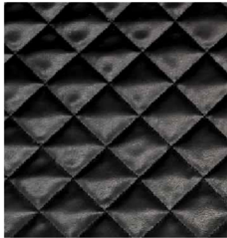
NERO - 31