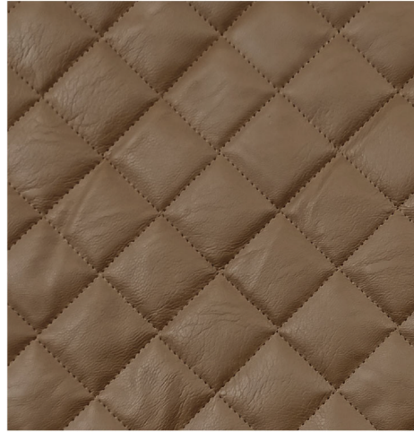
MARRONE CHIARO - 35