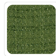
Verde Prato - N018