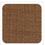
Cammello - 025