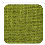
Verde - N054