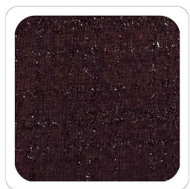
Bordeaux - G718