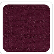
Vinaccia - P315