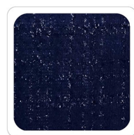
Blu - L002