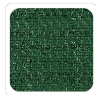
Verdone - N245