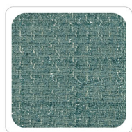
Verde Acqua - N801