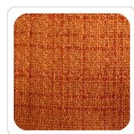
Arancio - E651