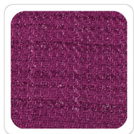
Orchidea - G438