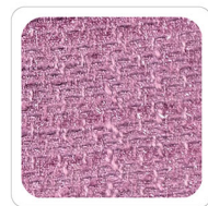
Violetto - G162