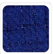
Blu Royal - L508