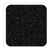
Nero - Z001