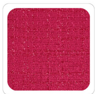
Fuxia - H850