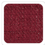
Rosso Scuro - P460