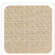
Beige - E011