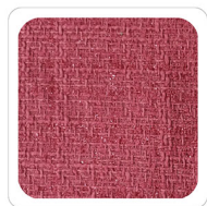
Corallo - H361