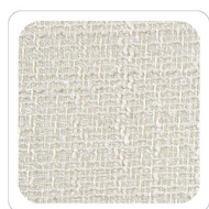
Bianco Latte - A011