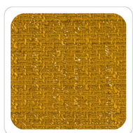
Senape - D942