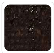
Marrone - C304