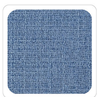
Azzurro - L673