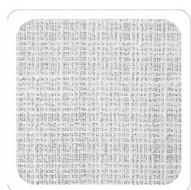
Bianco - A010