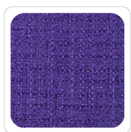
Viola - 045