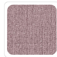
Rosa Antico - H508