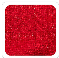
Rosso - F410