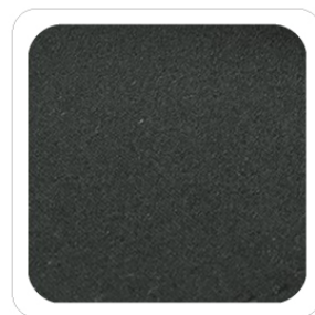
Grigio - 21