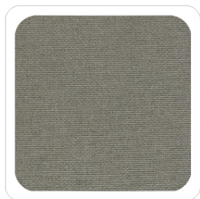
Perla - 55