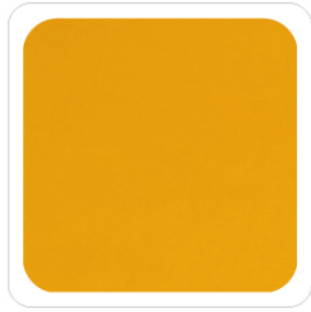
Giallo - 08