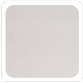
Bianco - 01