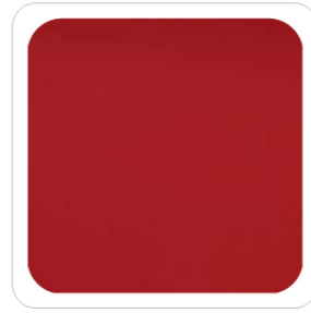
Rosso - 57