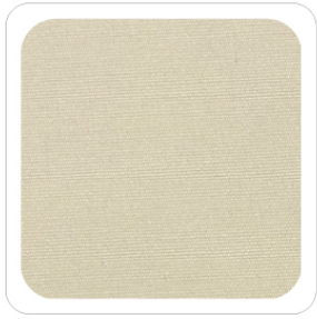
Bianco Latte - 56