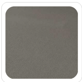
Tortora - 20