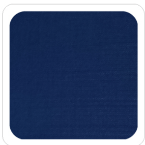
Blu - 18