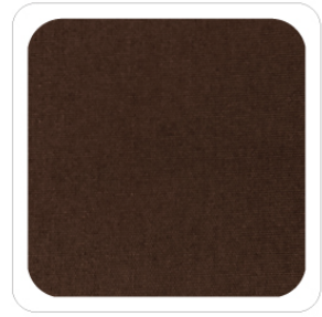
Castagna - 73