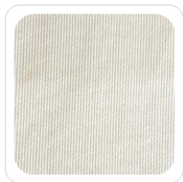
Panna - 92