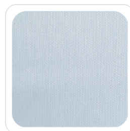
Celeste Chiaro - 401