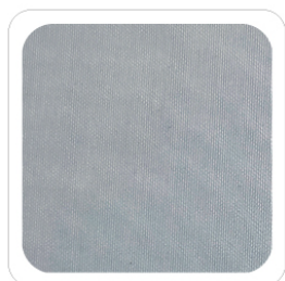
Carta da Zucchero