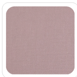
Rosa - 306