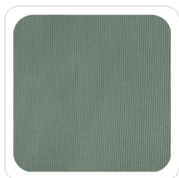
Verde Salvia - 8