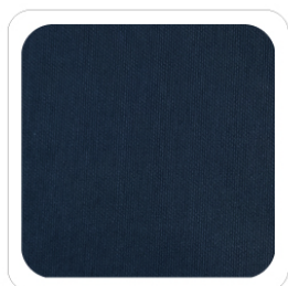
Blu Notte - 04