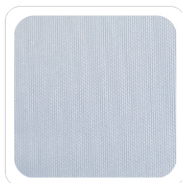
Celeste - 402