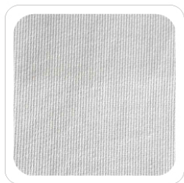
Bianco - 91