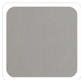
Grigio - 701