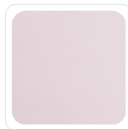
Rosa Baby - 304