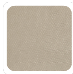
Sabbia Chiaro - 101