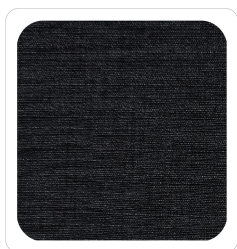
Nero - 069