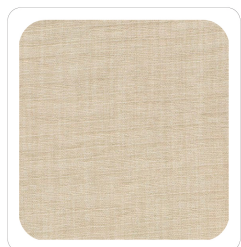
Beige - 052