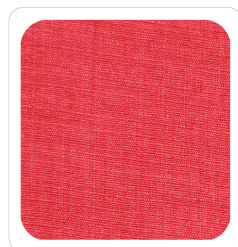
Corallo - 016