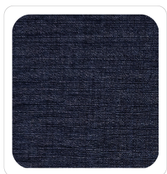
Navy - 08