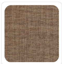
Tortora - 054