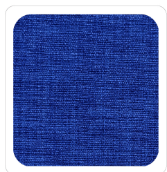
Bluette - 005