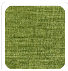
Verde - 027