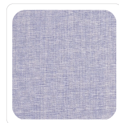
Lilla - 043