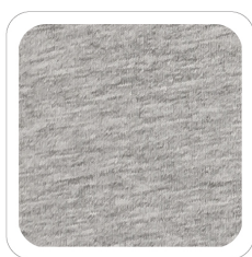
Grigio Chiaro - 97