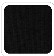
Nero - 99