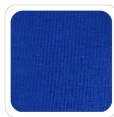
Bluette - 87