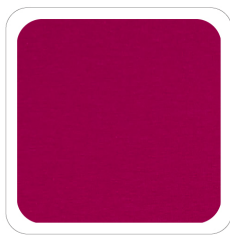
Fuxia Chiaro - 263