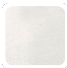
Bianco - 10