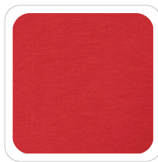
Rosso - 260