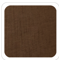
Nocciola - 29