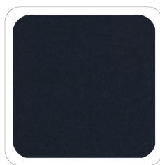
Blu - 88