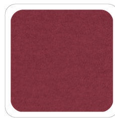
Rosso Scuro - 18