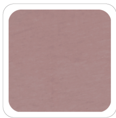
Rosa Antico Chiaro - 64