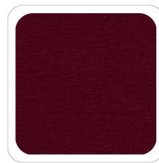
Vinaccia - 262