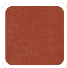
Bruciato - 57