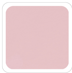
Rosa - 24