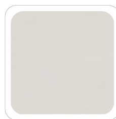
Panna - 13