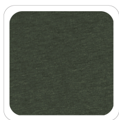
Verde Militare - 73